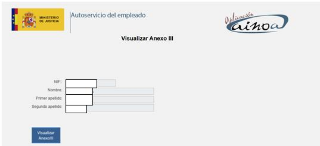
Figura 2 – Datos personales de Cl@ve

Una vez realizada la identificación electrónica navegará a la siguiente pantalla.